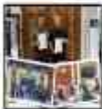
Program Literasi Masyarakat