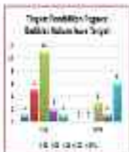
Gambar 2. Tingkat Penilaian Pernyataan Benar Siswa