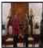
Program Literasi Masyarakat