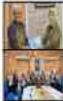
Program Literasi Masyarakat