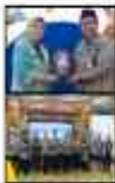
Program Literasi Masyarakat