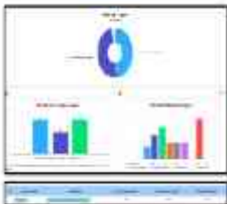
Figure 1: Management Accounting

The financial accounts are prepared for the business and are used for internal control and performance measurement. The financial accounts are prepared for the business and are used for internal control and performance measurement. The financial accounts are prepared for the business and are used for internal control and performance measurement.