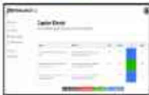
Figure 11.10: e-Finance

Use of IT systems to help control costs and reduce paper work. Financial firms use robust systems to help them transact and manage. (From the report on e-Finance) just about every financial firm.