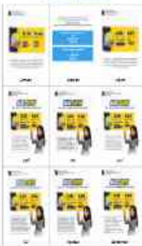
Figure 1. Early Report Request

As a result of the early report request, the early report of the 2022-2023 Annual Report was published on December 15, 2022, which is earlier than the original schedule. The early report was published on December 15, 2022, which is earlier than the original schedule. The early report was published on December 15, 2022, which is earlier than the original schedule.