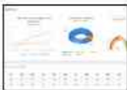
Figure 12.1: e-Procurement

Using online systems to reduce expenses from A.M.A. (American Medical Association) and other organizations. (From the report on e-Procurement) just about every financial firm.